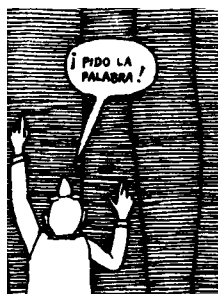
¡PIDO LA PALABRA!

A lo mejor nuestras expectativas con los adultos son que solamente deberían responder a nuestra invitación, pero que no tenemos por qué escuchar tanto sus inquietudes, como lo hacemos con los niños. Mi percepción es que posiblemente descuidamos un poco los 'cómo' y pensamos que la sola convocatoria va a ser suficiente.